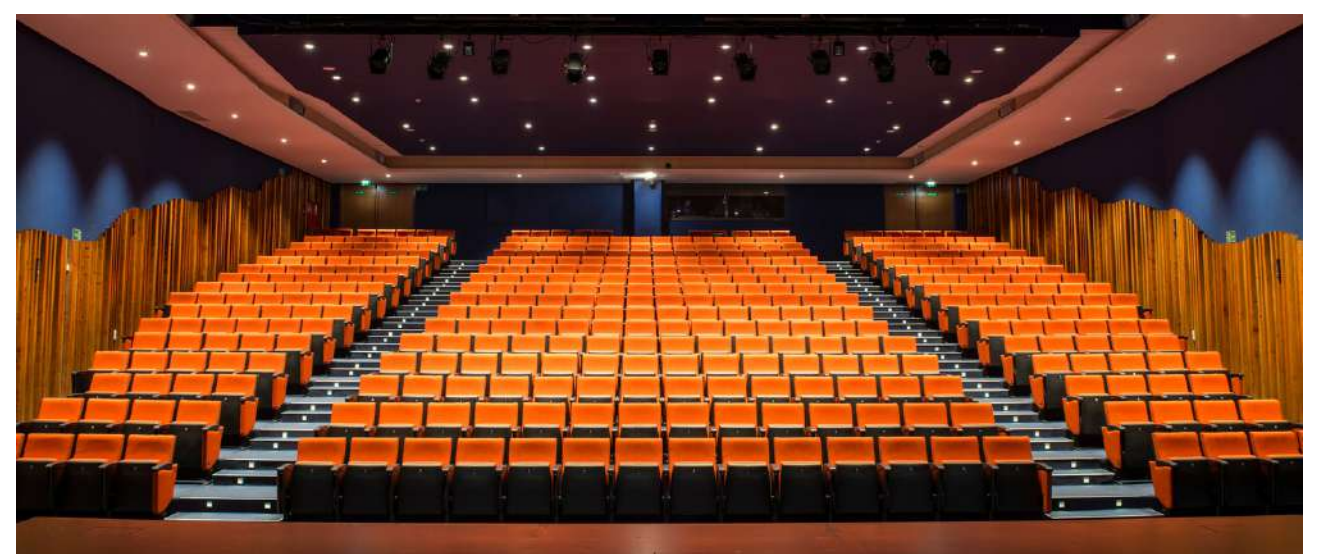
Teatro Fernández-Baldor | c/Arroyo de Viales, 4 | Torrelodones (Madrid)