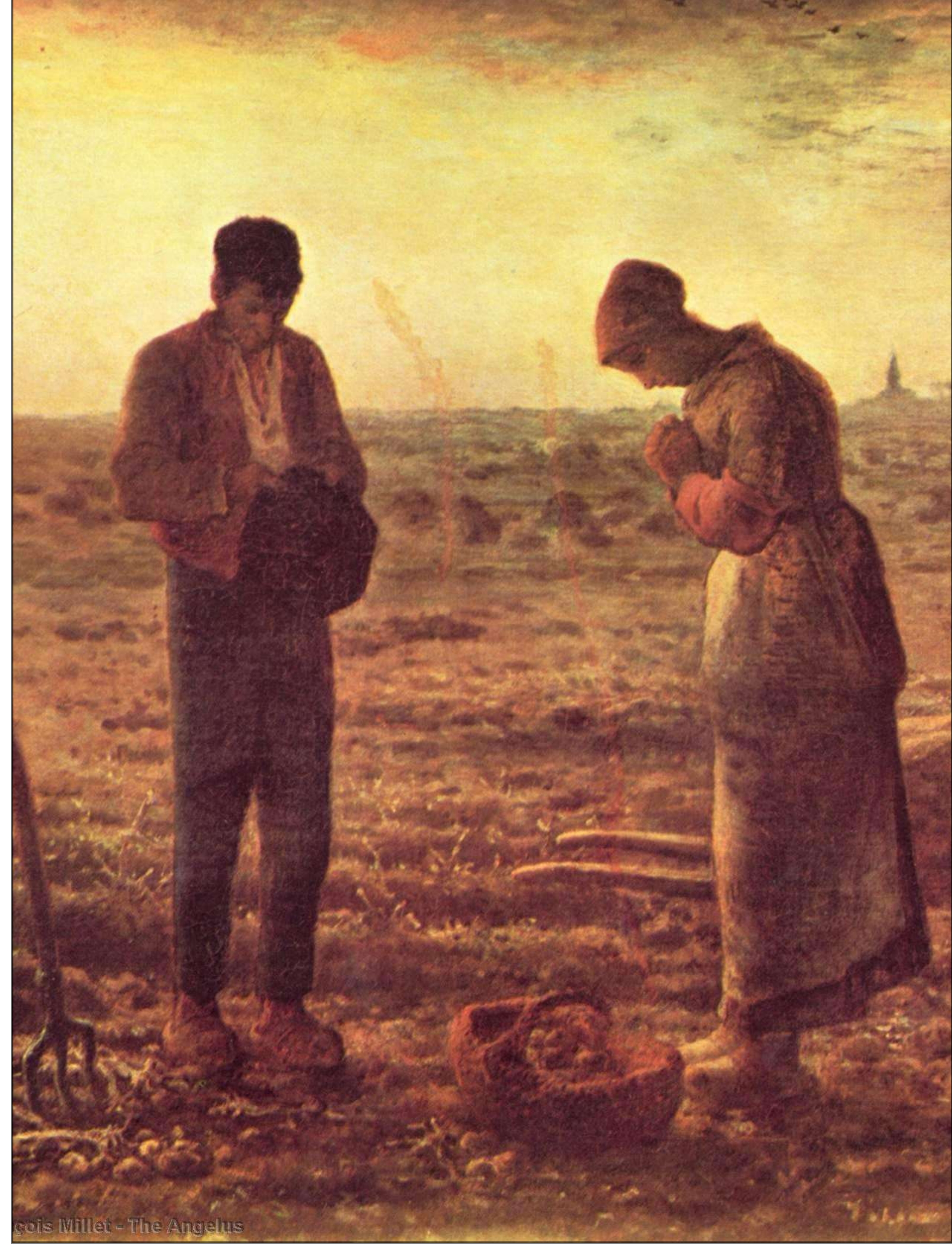
J.M.W. Turner - The Angelus

¿Qué puede cambiar en una persona cuando empieza el día rezando?